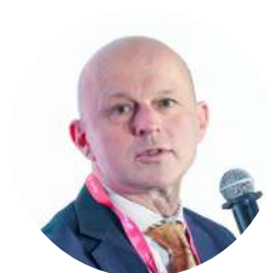
Członek Zarządu, Narodowy Bank Polski PAWEŁ SZALAMACHA