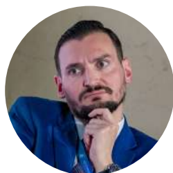
Fundacja im. Kazimierza Pułaskiego TOMASZ SMURA