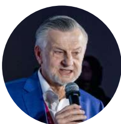
Doradca prezydenta RP, KPRP PROF. ANDRZEJ ZYBERTOWICZ